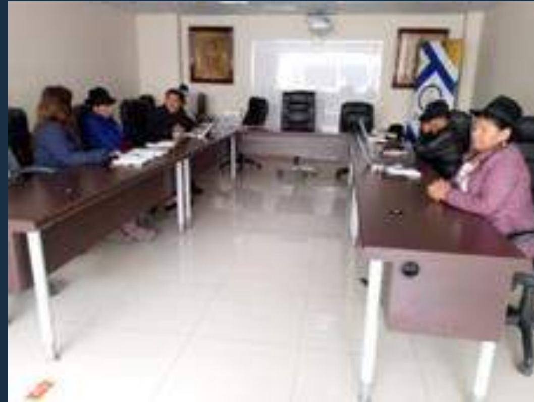
Sesión de los miembros de comisión de la igualdad de género, participación ciudadana y grupo prioritarios. Análisis y ordenanza sobre la nutrición infantil del Cantón Colta.