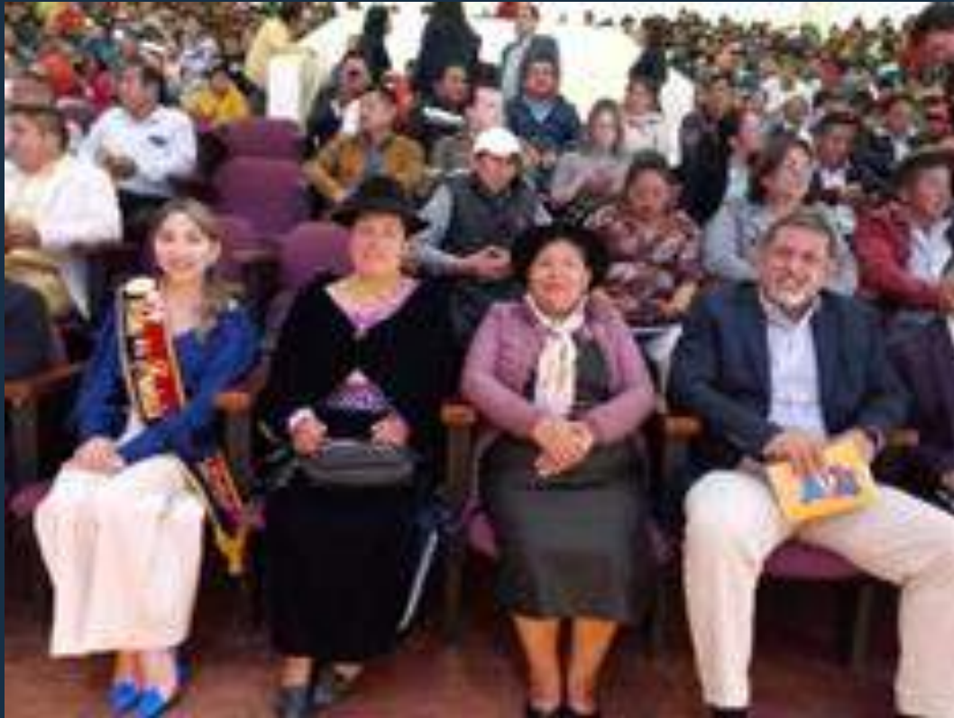
Entrega de mandato en el auditorio Dr. Romio Rodríguez de la Escuela Politécnica de Chimborazo.