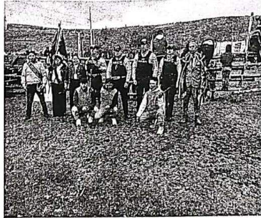
BARRIO SANTO CRISTO. VILLA LA UNIÓN. Sabado 21 De febrero De 2026