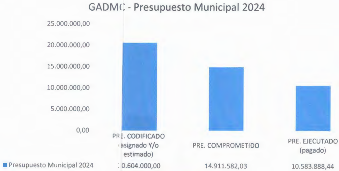
Gráfico 1: Ejecución presupuestaria del GADMCC 2024