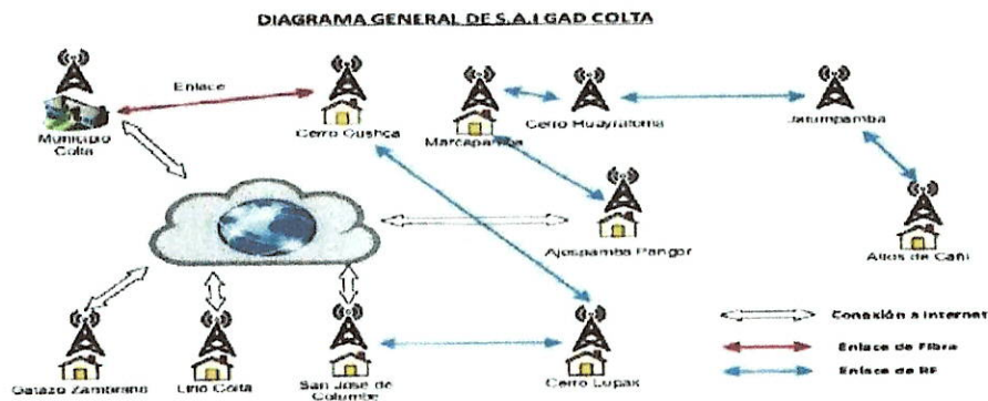
Figura 2. Diagrama General S.A.I.GAD COLTA (2)

En cuanto al diagrama general se puede observar que se están tomando en cuenta los puntos que no pertenecen a Colta, uno de ellos es el cantón Chimbo donde está la torre de San José de Chimbo y otra está ubicada en Guamote.