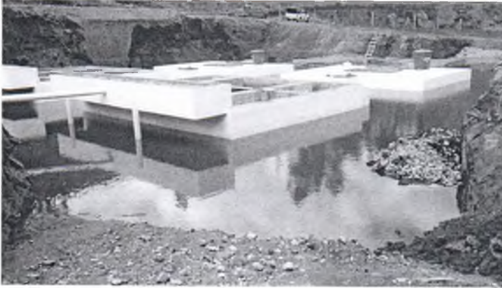
Paso del tubo por el río, donde se necesita de hacer un muro